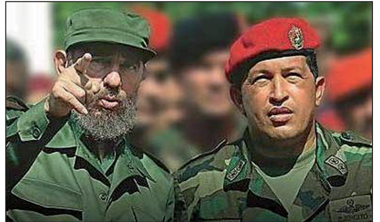
Chávez fue visto como un segundo Fidel Castro

El chavismo, al igual que la posición del capitalismo", http://es.internationalism.org/node/3417