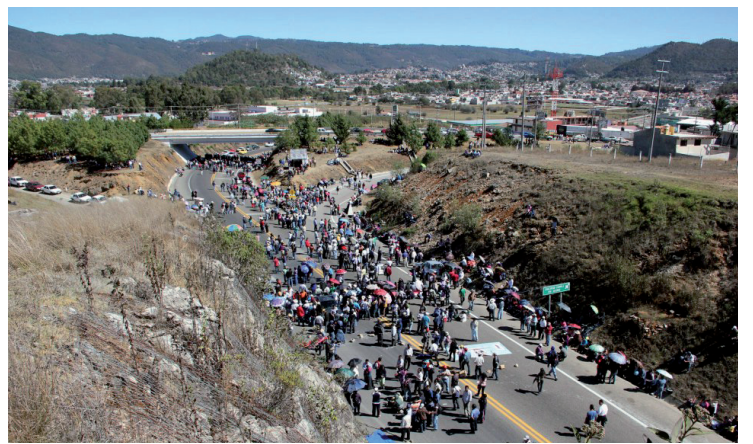
La remasterización del viejo arsenal de los métodos “radicales” de la CNTE en las últimas semanas nos hablan de la estrategia de movilizar para desmovilizar: bloquear vialidades, cerrar comercios “transnacionales”, caminar decenas, cientos o miles de kilómetros...

La remasterización del viejo arsenal de los métodos “radicales” de la CNTE en las últimas semanas nos hablan de la estrategia de movilizar para desmo-