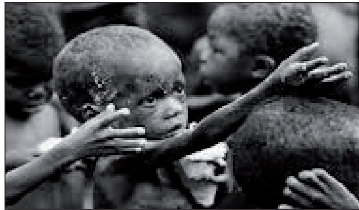
Uno de los ejemplos más escandalosos es la de los niños que sufren desnutrición grave en África subsahariana

Uno de los ejemplos más escandalosos es la de los niños que sufren desnutrición grave en África subsahariana, mientras que las cuotas lácteas y retirada de las granjas se imponen en Europa. ¡Mientras tanto, las organizaciones de beneficencia y las ONG organi-