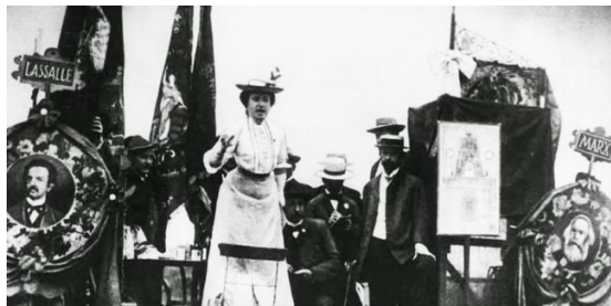
Rosa Luxemburgo en un mitin obrero

Y esta es una regla general de las revoluciones que involucran las masas de los oprimidos. La revuelta Espartaquista original de los esclavos en la Antigua Roma falló en que no marchó sobre la ciudad de Roma. En la Revolución Francesa de 1794, el programa de la comuna de guerra propagandística y republicana de Europa fue sabotada por Robespierre y el Comité de Salud Pública(4). Marx dijo que la Comuna de París, al tomar el poder en 1871,