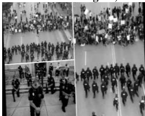
La burguesía arrodilla a sus policías y funcionarios para apropiarse del descontento social

En su respuesta a las protestas que estallaron inmediatamente en los EUA, la policía demostró que se trata de una fuerza de terror militarizada, con o sin la ayuda del ejército. La brutal represión de esas manifestaciones –10 mil detenciones en los EUA– evidencia que las policías, en los EUA, como en otros países “democráticos”, actúan de la misma manera que la policía de regímenes abiertamente dictatoriales como Rusia o China.