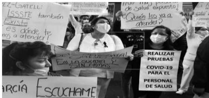
Trabajadores de la salud se manifiestan en las calles para exigir condiciones e instrumentos básicos para su protección

La entrada del año 2020, ya anunciada como una cuesta económica con gruesos nubarrones recesivos (ver artículo sobre la crisis en este número), trajo al descubierto el horror y la barbarie de este sistema de producción en plena descomposición que es el capitalismo, con la pandemia del Covid-19. Muchos justifican la irresponsabilidad de los gobiernos al subestimar el problema, arguyendo que se trata de “algo nuevo” y por eso los Estados no estaban preparados. Incluso, así se trate de países del “primer mundo”, todas las condiciones miserables de la infraestructura hospitalaria y el colapso de los sistemas de salud, no son el resultado de la pandemia, sino que son consecuencia de décadas de dismantelamiento de los sistemas de seguridad social (pensiones, salud, educación, etc...) a escala planetaria, porque para el capitalismo simplemente “no son áreas rentables”. Además, desde hace casi dos décadas colectivos de investigadores ya habían advertido que era altamente probable una pandemia de este tipo y que se debía invertir más en investigación y en recursos de prevención, sin embargo, ningún gobierno se hizo eco pues implicaba desviar a esas áreas “no rentables” un capital que siempre será requerido para apuntalar la plusvalía de la burguesía en su conjunto.