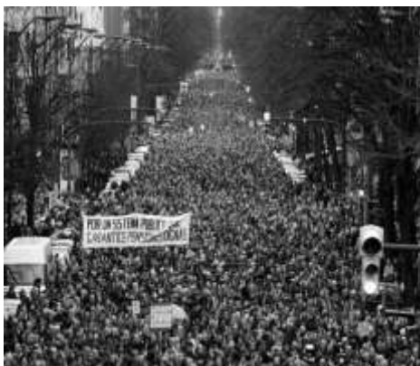
Manifestaciones masivas en Francia en contra de la "reforma" a las pensiones

ecológica". El aumento del precio de la gasolina y el gasóleo ha enfurecido a la gran mayoría de la población, especialmente a los sectores que dependen de sus automóviles para ir al trabajo o acompañar a sus hijos a la escuela debido a la falta de transporte público. Por eso el movimiento ha sido particularmente fuerte en las zonas periurbanas, en las pequeñas ciudades de provincia y en el campo. Por eso también es un movimiento interclasista en el que encontramos pequeños jefes, artesanos, enfermeros autónomos, campesinos, etc., así como pequeños agricultores. Obviamente no es casualidad que este movimiento de chalecos amarillos haya recibido, desde el principio, el apoyo de los partidos de la derecha y del Reagrupamiento Nacional de Marine Le Pen con el lema: "hay demasiados impuestos". Así, podemos ver al líder del partido de derecha "Les Républicains" (el partido de Chirac y Sarkozy) con un chaleco amarillo. Incluso Brigitte Bardot, conocida por sus simpatías por Le Pen, publica una foto suya con un chaleco amarillo.