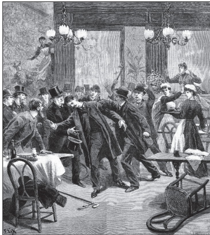
Esa práctica que se presume “heroica y ejemplar” no es más que una acción suicida cuyo único efecto es abastecer de víctimas al terror del Estado

El proletariado, como última clase explotada de la historia, es portador de la solución a todos los desgarrs, a todas las contradicciones y callejones sin salida en que se ha empantanado la sociedad. Esta solución no es sólo una respuesta a la explotación que soporta la clase obrera. Es la solución para la sociedad entera, pues el proletariado no puede liberarse sin liberar a la humanidad entera de la división de la sociedad en clases y de la explotación del hombre por el hombre. Esta solución, la de una comunidad humana libremente asociada y unificada, es el comunismo. Desde