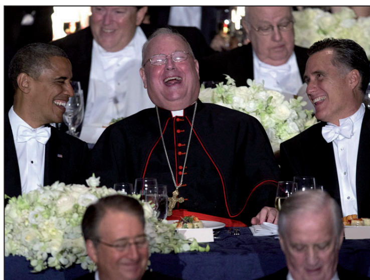
Está claro que, en este nivel, la única diferencia real entre los dos partidos es el ritmo y la fuerza con las cuales los ataques van a caer sobre nosotros.

Parecen creer que las recetas de la era Clinton pueden ser resucitadas y aplicadas hoy en día, sin tener en cuenta el contexto histórico y económico. No sabemos si realmente la administración de Obama cree realmente en esta campaña mediática que dice que la economía iría mejor bajo esos criterios de gobierno. No importa, aunque reconozcan la necesidad de un relanzamiento, no podrán hacer nada en ese sentido. Cualquiera que sea el nuevo modo de cooperación que adopte el Partido Republicano como consecuencia de su aplastante derrota electoral, es poco probable que se adhiera a una política de recuperación económica. La Reserva Federal ha sido llamada recientemente para actuar por su cuenta mediante la compra de valores hipotecarios, pero los economistas más serios están de acuerdo en decir que ésta sólo tendrá el mismo efecto sobre la economía que la picadura de un mosquito sobre la piel de un elefante.