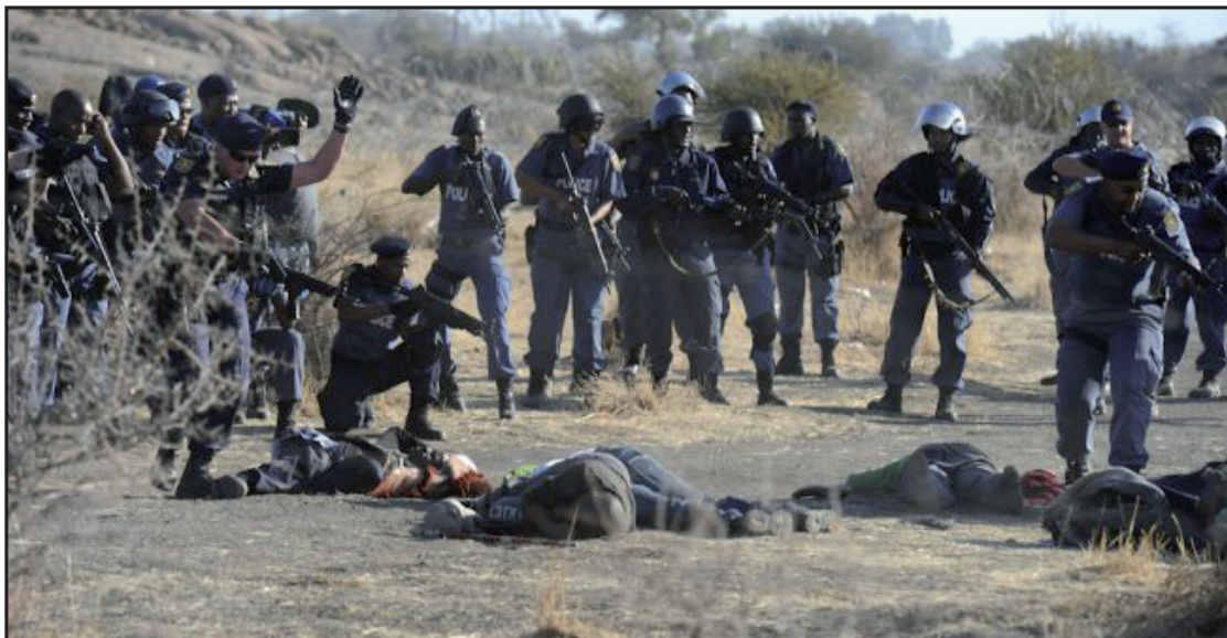
Cuanto más se manifiestan las dificultades internas tanto más se manifiesta la resistencia obrera, y más sangrienta es aún la represión