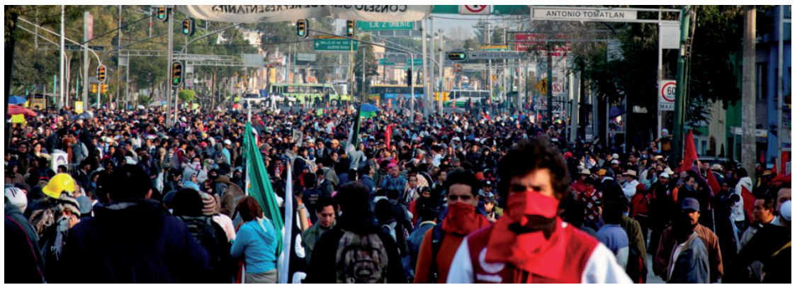
Las manifestaciones del primero de diciembre expresan un verdadero descontento y un repudio abierto

Los enfrentamientos y los destrozos que se sucedieron como respuesta al retorno del PRI al gobierno, pudieron ganar las pri-