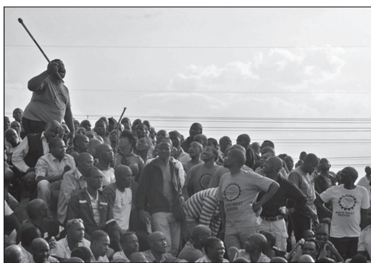
La huelga que se mantiene en la mina de platino de Marikana, en Sudáfrica, amenaza con extenderse a otros yacimientos del país, donde los trabajadores reclaman mejoras salariales y condiciones laborales dignas.

5) Comunicado de Lonmin el domingo, 19 de agosto de 2012.